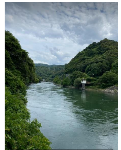
Rivière Uji à Uji