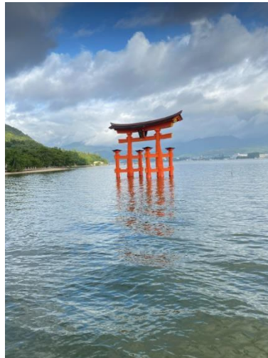
Sanctuaire de Miyajima (Hiroshima)