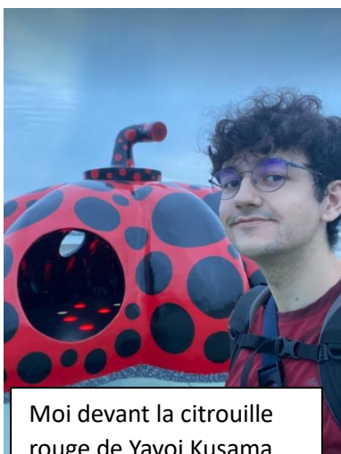
Moi devant la citrouille rouge de Yayoi Kusama sur l'île de Naoshima