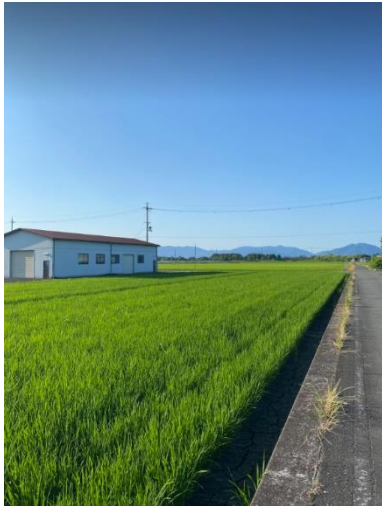
Champ de riz à Takashima

Ci-dessous quelques photos de mon séjour au Japon ou chacune évoque un souvenir riche.